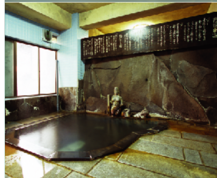
泉質／含芒硝石膏硫黄泉(硫黄温泉) 浴室／男湯・女湯 各1ヶ所(シャンプー有)

天然岩を屏風立てにした本格的岩風呂。 こんこんと湧き出る豊富な湯量の かけ流し天然温泉。 手足を伸ばしてのんびりつかれば 日常の疲れも癒されます。 時間がゆっくり流れて いつの間にか身体も心も元気。